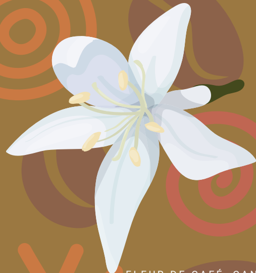
FLEUR DE CAFÉ, CANVA

“Le café est en effet originaire d'Éthiopie, plus exactement du royaume de Kaffa.”